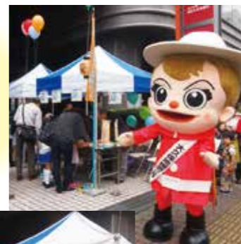
大久保まつり ・百人町まつり