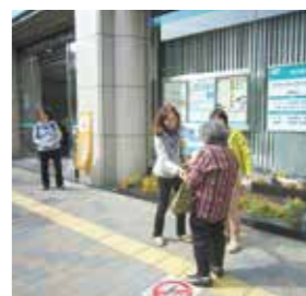
10月14日 振り込め詐欺見守り活動